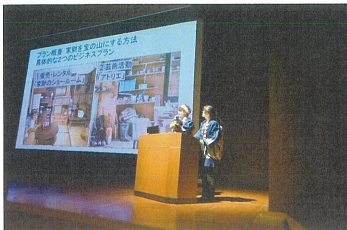
「プレゼンテーションの様子」