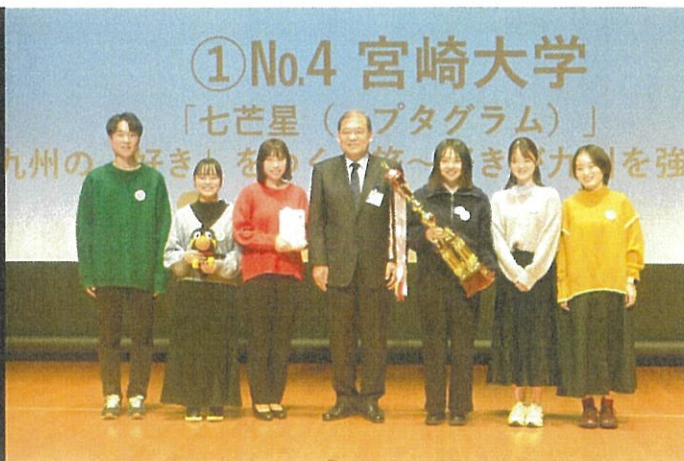
「昨年度(2023年) 最優秀賞 宮崎大学」