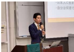
西海市議会議員 浅川 容行先生 「若きリーダーが語る、地域と政治への想い」