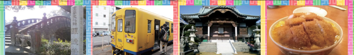
안경다리 주위의 경관이 아름다워요~>>0<< 다리 위에서 동전을 던지고 소원을 말해봐~ 이사하야역 교통의 중심지 이사하야역 케이간지 돌 벽에 그려진 부처가 인상 깊다 드래곤 식당 맛도 으뜸 양도 으뜸 쟁 맛있는음 >><<